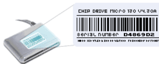
Tabela 1 - Posicionamento do código de barras nas leitoras de smart card

Localize o código de barras na parte inferior da leitora conforme as figuras abaixo: