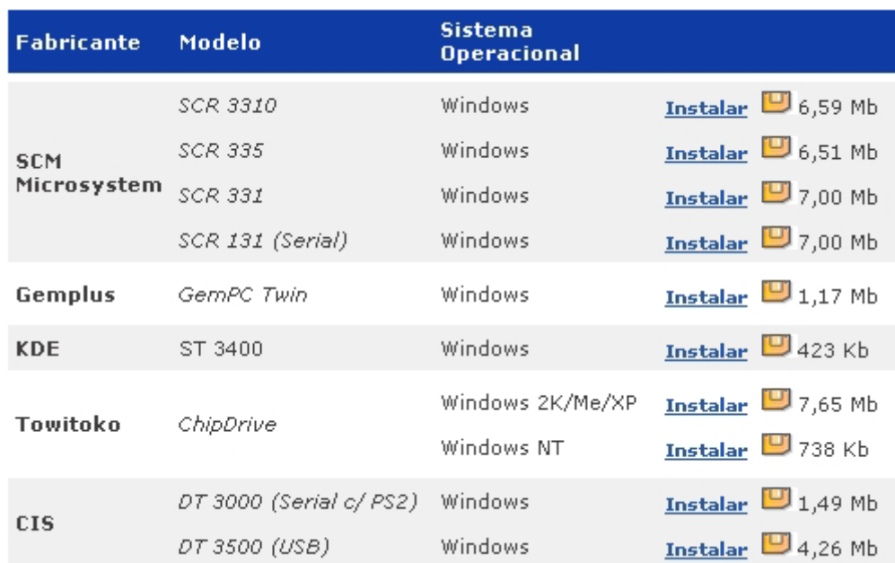
Tabela 2 - Drivers de Leitoras no site www.certisign.com.br

Com o fabricante e o modelo identificados, você já é capaz de localizar o driver correto da sua leitora na tabela 2 (também disponível em nosso site www.certisign.com.br , na sessão Suporte > Drivers de Leitoras, ou ainda em nosso CD-ROM, na opção Drivers > Leitoras ).